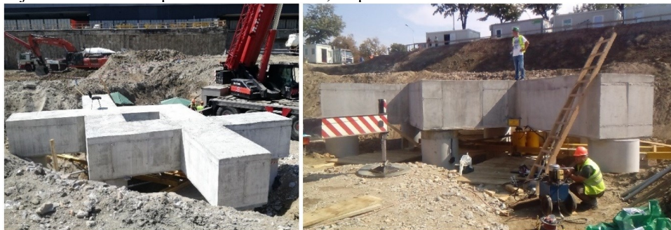
Slika 4. Sprovedena SLT ispitivanja nosivosti šipova za objekat–kulu Ušće 2

Na slikama 4 i 5 prikazana su sprovedena ispitivanja nosivosti šipova za objekat–kulu Ušće 2 primenom SLT i DLT, respektivno.