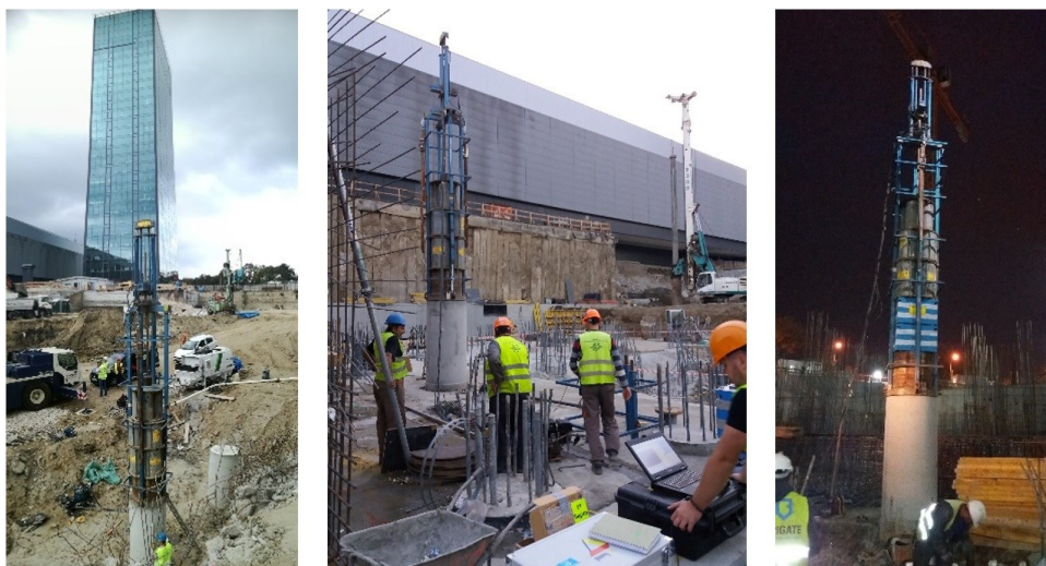
Slika 5. Sprovedena DLT ispitivanja nosivosti šipova za objekat–kulu Ušće 2

Bazni pokazatelji efikasnosti upravljanja kvalitetom ispitivanja integriteta i nosivosti šipova jesu: količina (obim) ispitivanja šipova, vreme potrebno da se sprovede pojedinačno ispitivanje i sva ispitivanja šipova, troškovi pojedinačnih i svih ispitivanja šipova i kvalitet sprovedenih ispitivanja šipova.