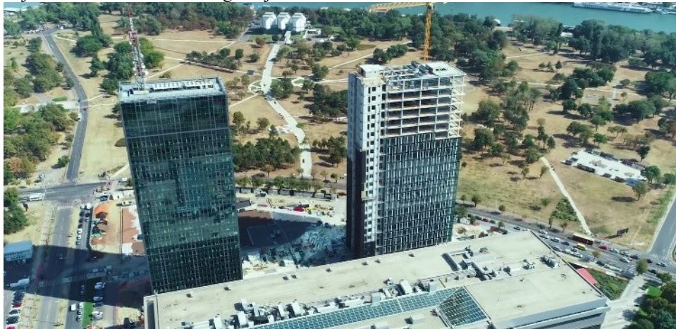
Slika 2. Objekat–kula Ušće 2 u fazi izgradnje [6]

Temeljna konstrukcija sastoji se od 146 armiranobetonskih bušenih šipova. Preko šipova postavljena je armiranobetonska ploča debljine. Na slici 2 prikazan je objekat–kula Ušće 2 u fazi izgradnje.