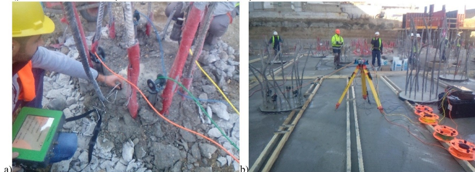
Slika 3. Sprovedena ispitivanja integriteta šipova za objekat–kulu Ušće 2: a) SIT, b) CSL

Na slikama 3a i 3b prikazana su sprovedena ispitivanja integriteta šipova za objekat–kulu Ušće 2 primenom SIT i CSL, respektivno.