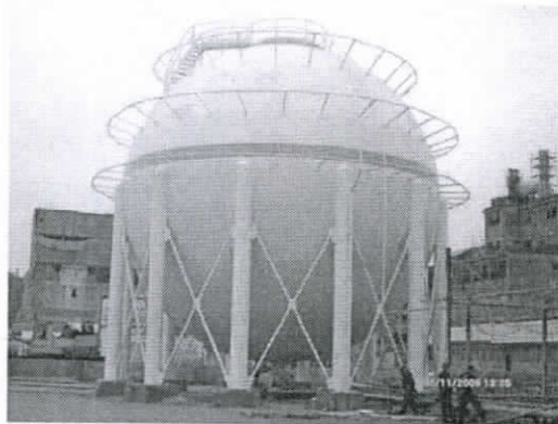
b) posle sanacije