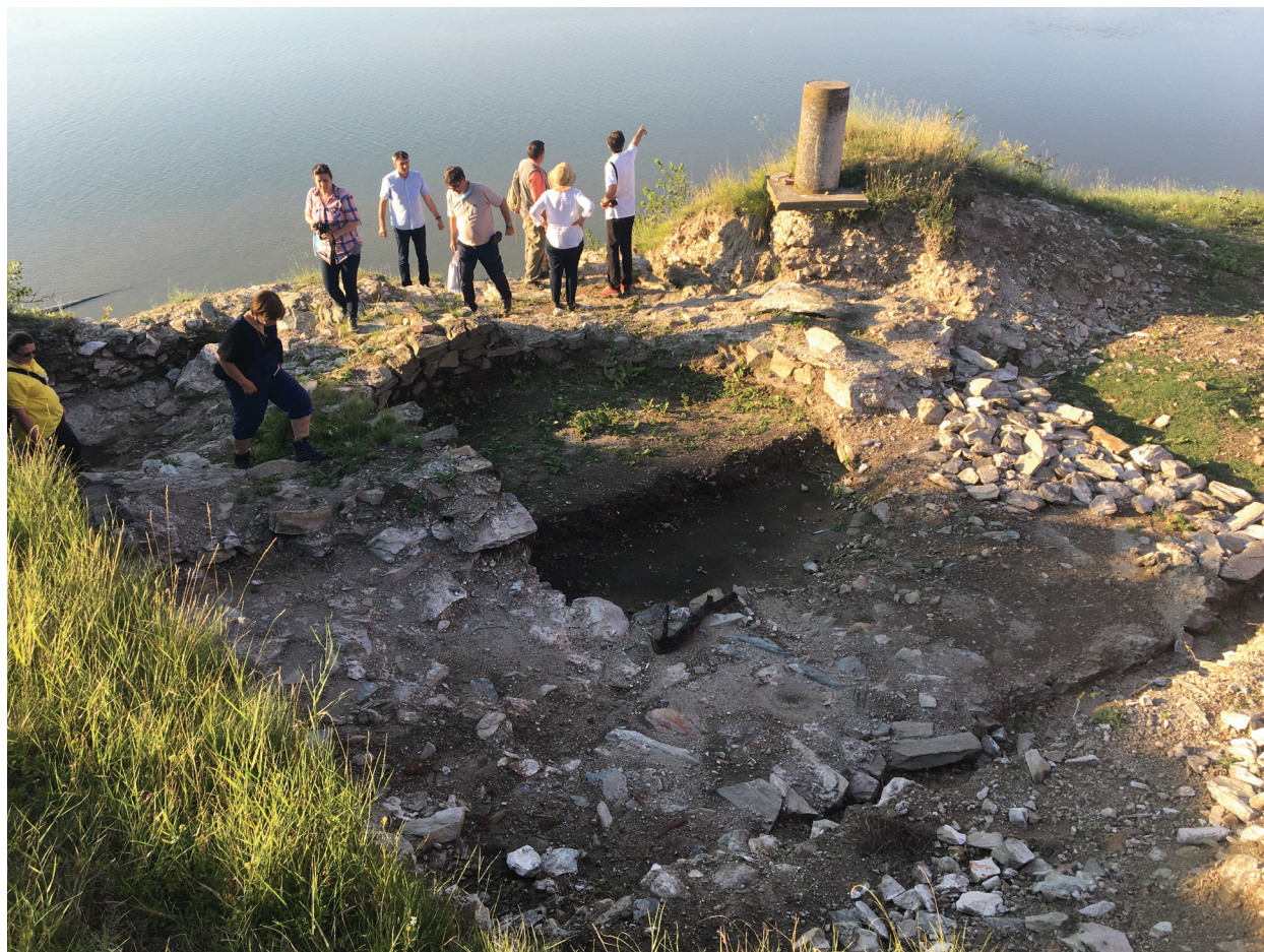
Slika 2 – Ekipa projekta MoDeCo2000 prilikom obilaska SI ugaone kule Lederate (Ram).

severnog bedema legijskog logora, neposredno istočno od severne kapije ( porta praetoria ), i to iz obe faze gradnje – kraj 1. i početak 2. veka– (Bogdanović et al. 2021). Uzorkovani su i ostaci maltera iz jezgra i sa lica zidova principije, koji vremenski odgovaraju severnom bedemu (Mrđić, Marjanović 2021). Na lokalitetu Pirivoj malter je uzorkovan iz zidova i poda vile rustike iz 3. veka (Redžić et al. 2021). Najveći broj uzoraka maltera uzorkovan je na lokalitetu Terme, i to maltera koji se koristio za zidanje, za malterisanje zidova i za izradu podova, iz više faza korišćenja tog objekta (2–4. vek) (Nikolić et al. 2017). Na Margumu je uzorkovan malter iz tzv. Malog kupališta, iz prostorije s hipokaustom i apsidom iz 2–3. veka (Цуњак 1995-1996).