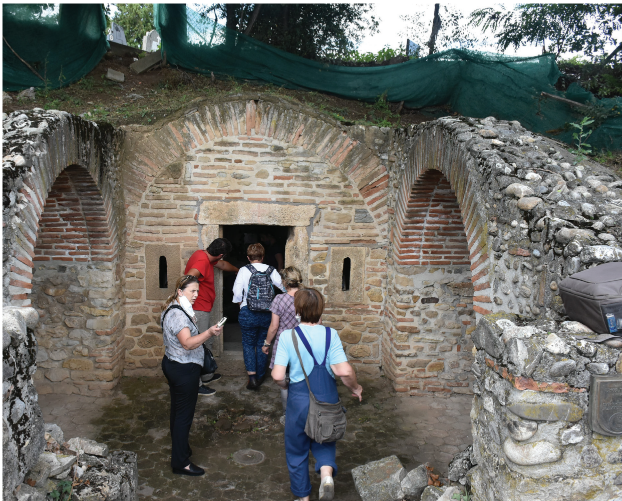
Slika 6 – Ekipa projekta MoDeCo2000 prilikom obilaska kasnorimske grobnice u Brestoviku.

lokalitetu Četaće, malter je uzet iz ostataka zida severozapadnog ugla utvrđenja, koje se okvirno datuje u kasnoantički– ranovizantijski period (Kondić 1965).