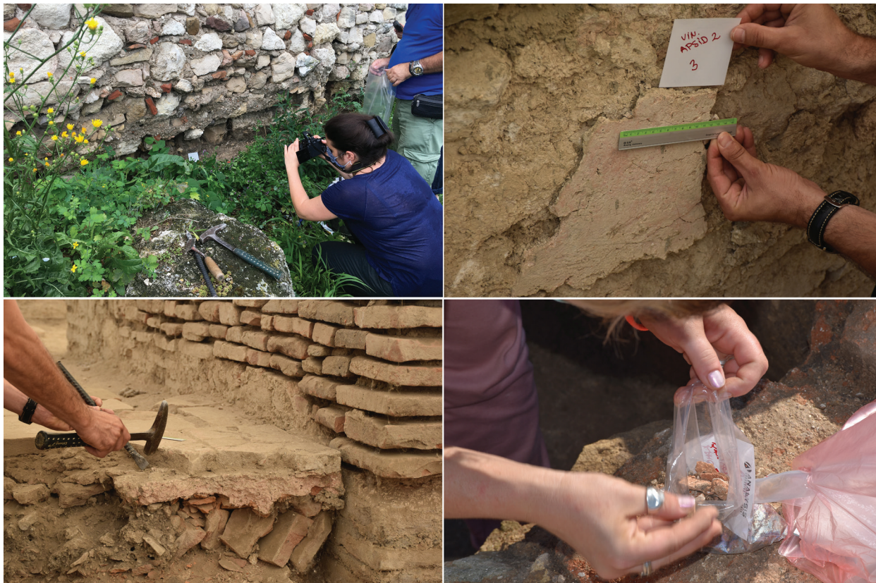
Slika 1 – Proces uzorkovanja maltera na antičkim objektima (foto-dokumentacija projekta MoDeCo2000).

u mlađu (4/6. vek) i stariju fazu (2/3. vek) logora (Васић 1984). U Golupcu uzorci su uzeti iz ostataka severnog bedema vojnog utvrđenja kod SI ugaone kule, koja se, prema dostupnim podacima, datuje okvirno, u period od 4. do 6. veka (Kondić 1965, 74–75; Petrović, Vasić 1996, 22). Takođe, u Golupcu su uzorci maltera uzeti i iz ostataka zidova i poda najistočnije prostorije takozvane "rimske kuće", antičke građevine iz 3. veka (Бунарџић 2015, 24–29). U selu Ram, na utvrđenju Lederata uzorkovan je malter iz bedema rimske tvrđave iz sve tri faze gradnje, od kraja 1. do 6. veka (Цуњак, Јовановић 2014). U Ramskoj tvrđavi uzeto je više uzoraka maltera iz zidova kule 4 utvrđenja iz turskog perioda (Симић, Симић 1984), radi sagledavanja tehnološkog kontinuiteta u proizvodnji maltera u oblasti Stiga, odnosno antičkog Viminacijuma. Tom prilikom uzorkovani su i komadi maltera iz novootkrivenih zidova objekta koji se nalaze ispod ostataka poligonalne građevine u središnjem delu tvrđave.