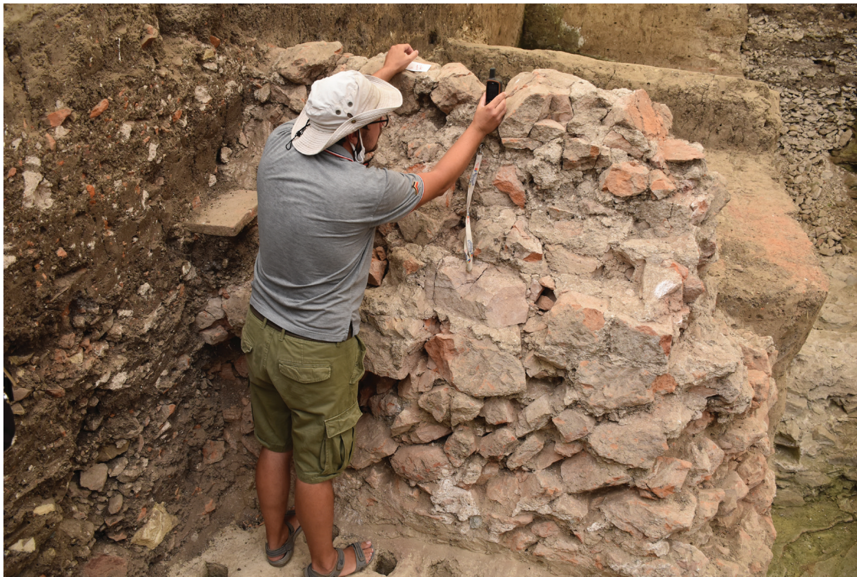
Slika 3 – Uzorkovanje maltera sa severnog bedema legijskog logora na Viminacijumu (Stari Kostolac) (foto-dokumentacija projekta MoDeCo2000).

4–6). U Singidunumu je uzorkovan malter na dve lokacije. Prvi uzorci potiču iz SZ bedema vojnog logora, gde se nalaze i najočuvaniji delovi zidina, a koji se datuje u početak 2. veka (Popović 1971, 94–97; Popović 1997, 6; Pop-Lazić 2018). Druga uzorkovana lokacija jeste jugoistočna kapija ( porta decumana ), koja se danas nalazi u Rimskoj dvorani Biblioteke grada Beograda i koja se datuje u kraj 3. i početak 4. veka (Popović 1997, 7; Pop-Lazić 2018, 32). U Višnjici uzorkovani su ostaci maltera iz zida severozapadne kule tvrđave (Birtašević 1964), kao i iz istočnog bedema. Uzorci su datirani u šire razdoblje, od 4. do 6. veka. U Brestoviku ekipa je obišla ostatke monumentalne kasnoantičke grobnice i uzorkovala četiri malterna uzorka, kako za zidanje u prostoriji 3, tako i za izradu poda u prostoriji 1 sa grobnim mestima, odnosno maltera za malterisanje zida koji je služio kao podloga za fresko oslikavanje u prostoriji 2 (Milošević 1993; Nikolić et al. 2018). Uzorci se datuju u kraj 3. i početak 4. veka.