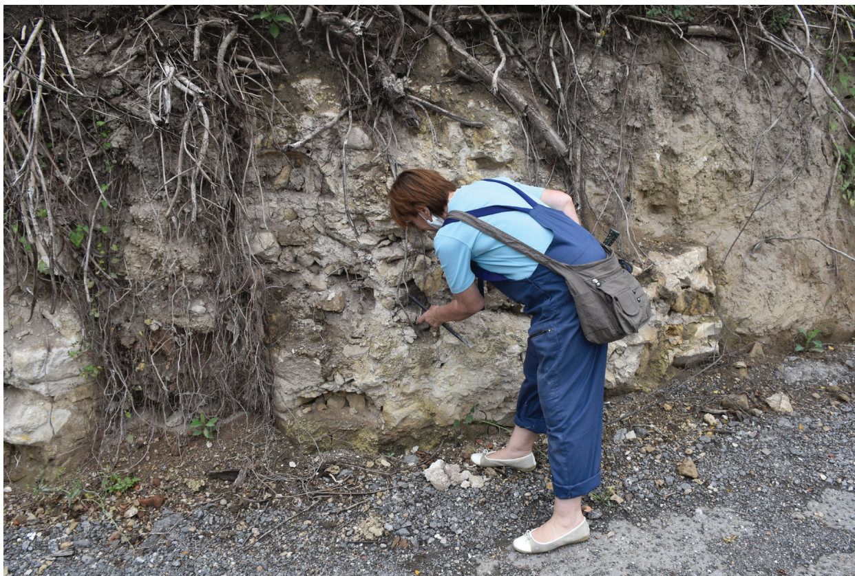
Slika 5 – Uzorkovanje maltera sa ostataka istočnog bedema utvrđenja Ad Octavum (Višnjica) (foto-dokumentacija projekta MoDeCo2000).

Šestog radnog dana, 27. 08. 2020. ekipa je obišla Rtkovo (Glamija), Brzu Palanku ( Egeta ), Mihajlovac ( Mora Vagei ), Prahovo ( Aquae ) i Radujevac (Četaće). U selu Rtkovu, na lokalitetu Glamija uzorkovan je malter iz središnjeg utvrđenja iz druge polovine 4. veka ( tetrapylon ), kao i iz SZ kule kružnog oblika utvrđenja iz 6. veka (Gabričević 1986). U Brznoj Palanci malter je uzorkovan iz ostataka severoistočne kule pravougaone osnove utvrđenja Egeta II, koje potencijalno datira u period kasne antike (Шпехар 2018), kao i iz bedema utvrđenja trougaone osnove, odnosno Egeta III, za koje se smatra da potiče iz 6. veka (Петровић 1984, 158–159). U selu Mihajlovac, na lokalitetu Mora Vagei , malter je uzorkovan iz ostataka kule stražare ( burgus ) iz kasnoantičkog perioda, na dve lokacije, iz jednog potpornog stuba ( tetrapylon ) i iz zapadnog ulaza u utvrđenje (Cermanović-Kuzmanović, Stanković 1986). U Prahovu malter je uzorkovan iz ostataka južnog gradskog bedema u blizini jugozapadnog ugla utvrđenja, a ti uzorci najverovatnije pripadaju 6. veku (Vučković - Todorović 1963). U Radujevcu, na