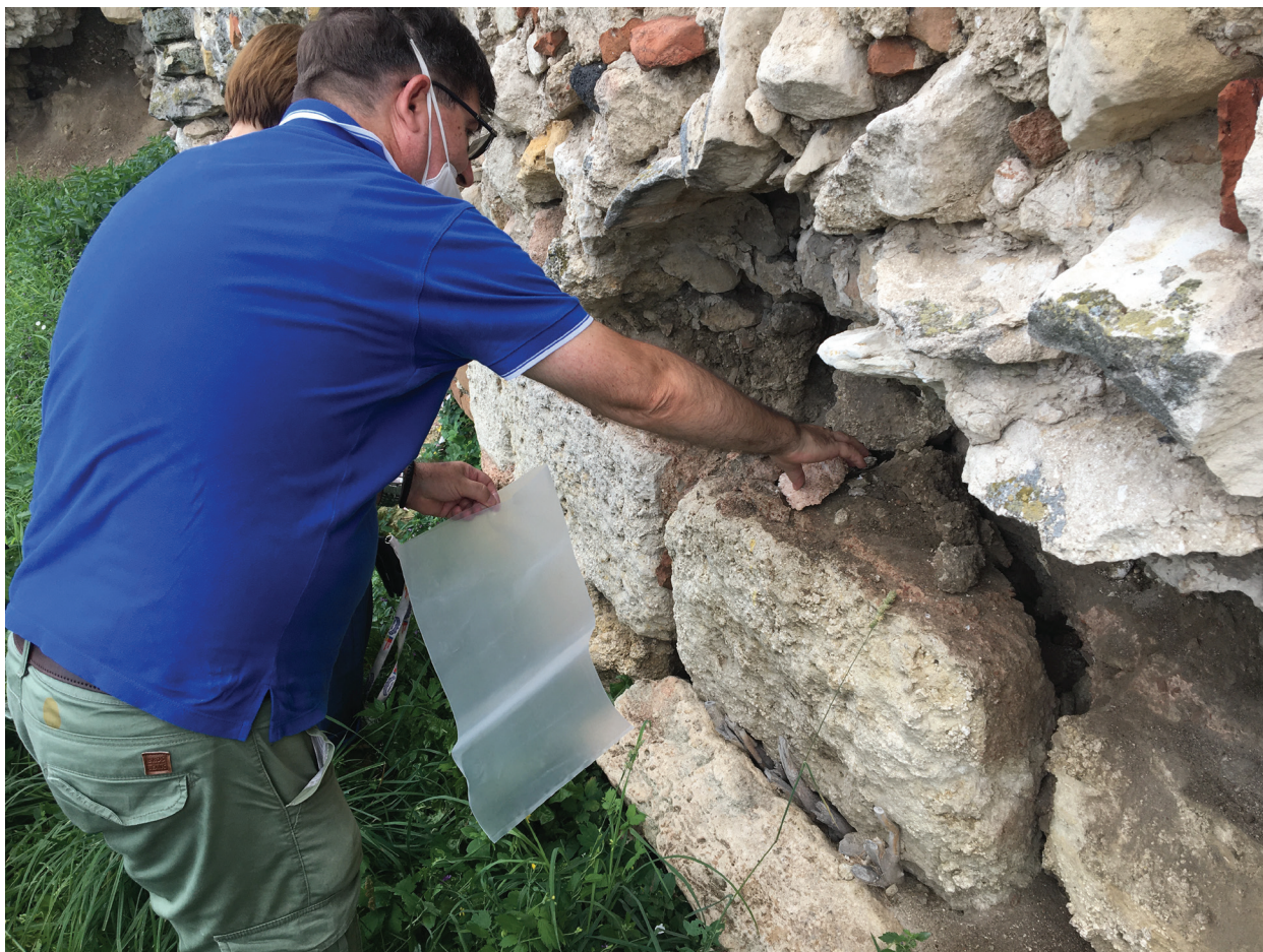
Slika 4 – Uzorkovanje maltera sa ostataka SZ bedema Singidunuma (Beograd) (foto-dokumentacija projekta MoDeCo2000).

Peti radni dan uzorkovanja bio je 26. 08. 2020. godine. Ekipa je obišla Kostol (Trajanov most i Pontes ) (sl. 7) i utvrđenje u Karatašu ( Diana ). U Kostolu malter je uzorkovan iz ostataka Trajanovog mosta, i to iz prvog i četvrtog stuba, sagrađenih početkom 2. veka (Гаршанин, Васић 1980; Vjelić 2020), kao i iz ostataka vojnog logora Pontes koji se nalazi pored mosta, gde je malter jedino mogao biti uzorkovan iz naknadno dograđene kule u SI delu kastruma, iz vremena dinastije Severa (Гаршанин et al. 1984). Na Dijani malter je uzorkovan na južnoj kapiji vojnog logora, i to iz nadzemnih delova na zapadnoj kuli potkovičastog oblika iz rano-vizantijskog perioda (Ранков 1984), kao i iz ostataka kasnoantičke građevine sa apsidom i bazenima (terme?), koja se datuje u 4. vek (Rankov-Kondić 2009).